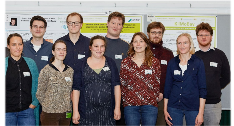
Einige unserer aktuellen (und amtierenden) BayWISS-Promovierenden